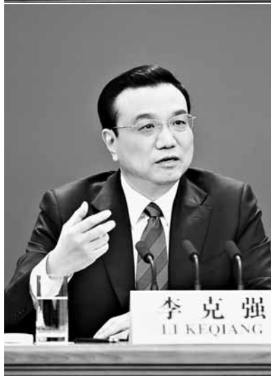
记者会总理表情