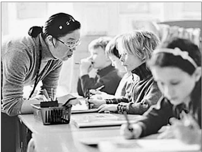
中国教师在英国小学授课。