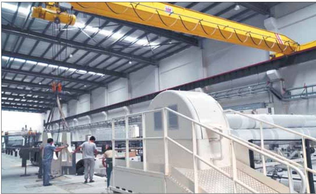
8月9日,在河南泓天雨高分子材料产业园内,工人们正对首条生产线进行设备安装。

“我们是从广东汕头过来的,专业做这种设备安装。”一名正在忙碌的工人介绍,“最近,加班到夜里十来点是常事,项目负责人希望早日安装完毕,尽快进入调试阶段。”