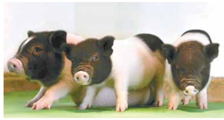
图为世界首批对器官移植无“毒”的活猪(4月27日摄)。

据新华社华盛顿8月10日电(记者 林小春)美国、中国和丹麦研究人员10日宣布，他们培育出世界上首批对器官移植而言无“毒”的活猪。首批对猪器官用于人体移植最重要的安全性问题，为全世界需要器官移植的数百万病人带来希望。