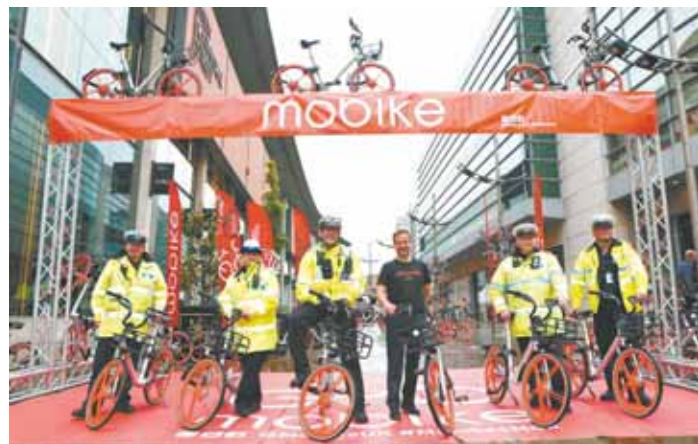
2017年6月29日，在英国曼彻斯特，几名警察在摩拜单车投放仪式上合影。