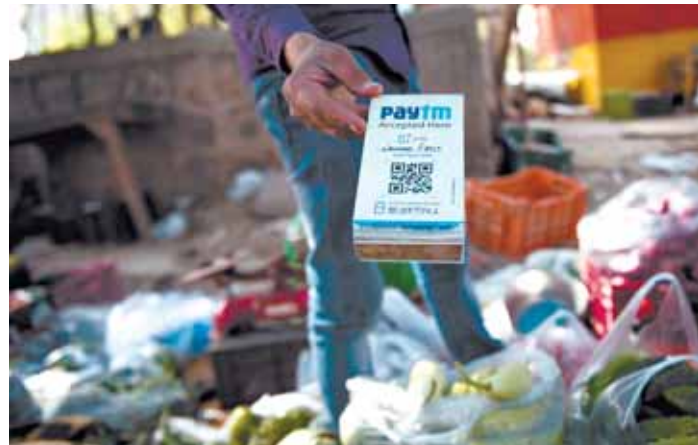
2017年4月12日，在印度新德里街头，一名蔬菜摊主手持Paytm二维码接受电子支付。印度Paytm在支付宝母公司蚂蚁金服的支持下，已经成为印度最大的移动支付平台。