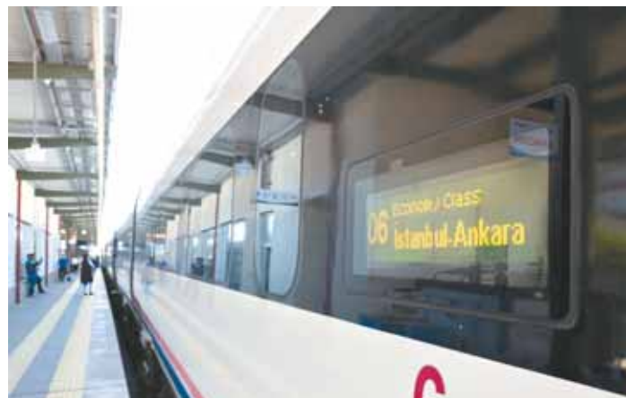
这是2017年4月30日在土耳其伊斯坦布尔彭迪克火车站拍摄的开往安卡拉的高铁列车。