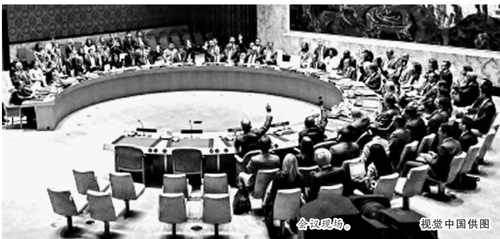
会议现场。

另据报道,俄罗斯总统新闻局11日发布通报说,俄总统普京当天应约与德国总理默克尔通电话讨论朝鲜半岛局势,双方强调朝鲜半岛危机只能通过谈判解决。通报说,普京与默克尔坚决谴责朝鲜无视联合国安理会决议的挑战行为,并指出,朝鲜的类似挑衅行为违反核不扩散条约,对地区和和平安