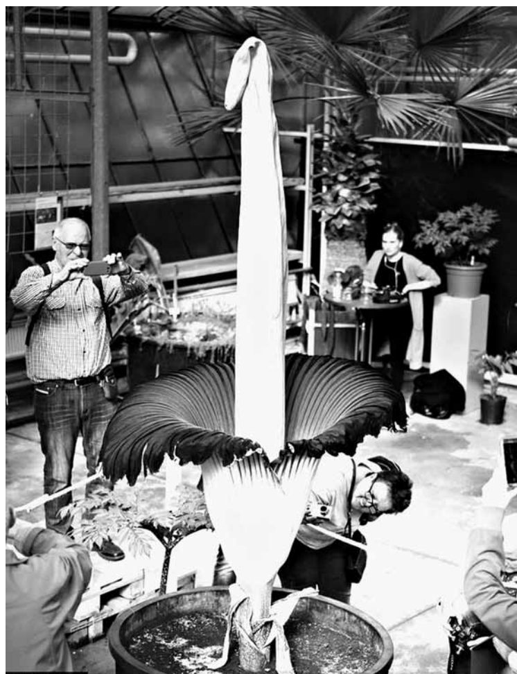
当地时间9月11日,德国波鸿,游客们围绕着植物园里的一株2米高的泰坦魔芋花拍照。泰坦魔芋原产于印度尼西亚苏门答腊的热带雨林地区,这也是泰坦魔芋首次在波鸿开放。 据视觉中国