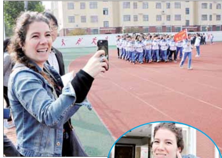
看到学生在操场上活动,乔丹兴奋地拿起了手机拍照。