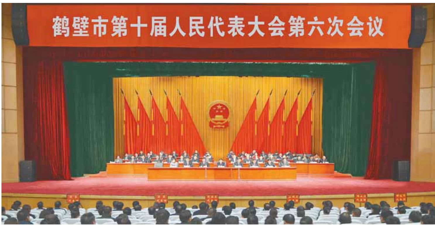
鹤壁市第十届人民代表大会第六次会议