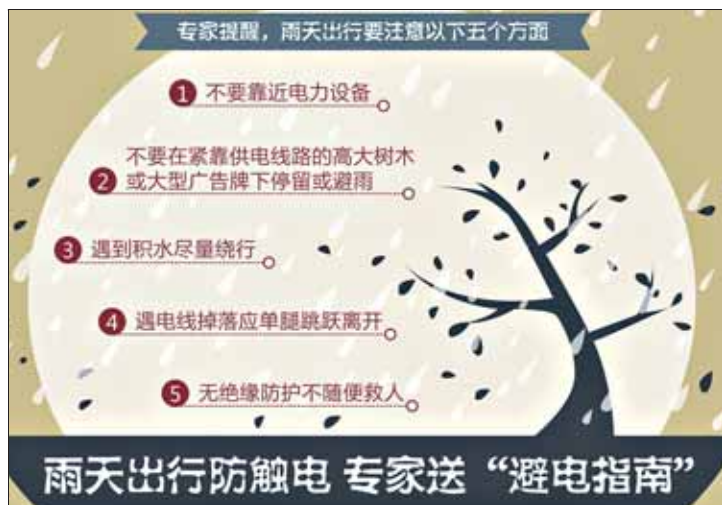
新华社发 朱禹 制图

据了解,在宪法宣传教育活动的开展过程中,该行各党支部都将宪法纳入学习内容,提高了全行员工的法律素质,弘扬了新时代宪法精神,为新时代推进全面依法治国、全面依法治国做出了积极努力。