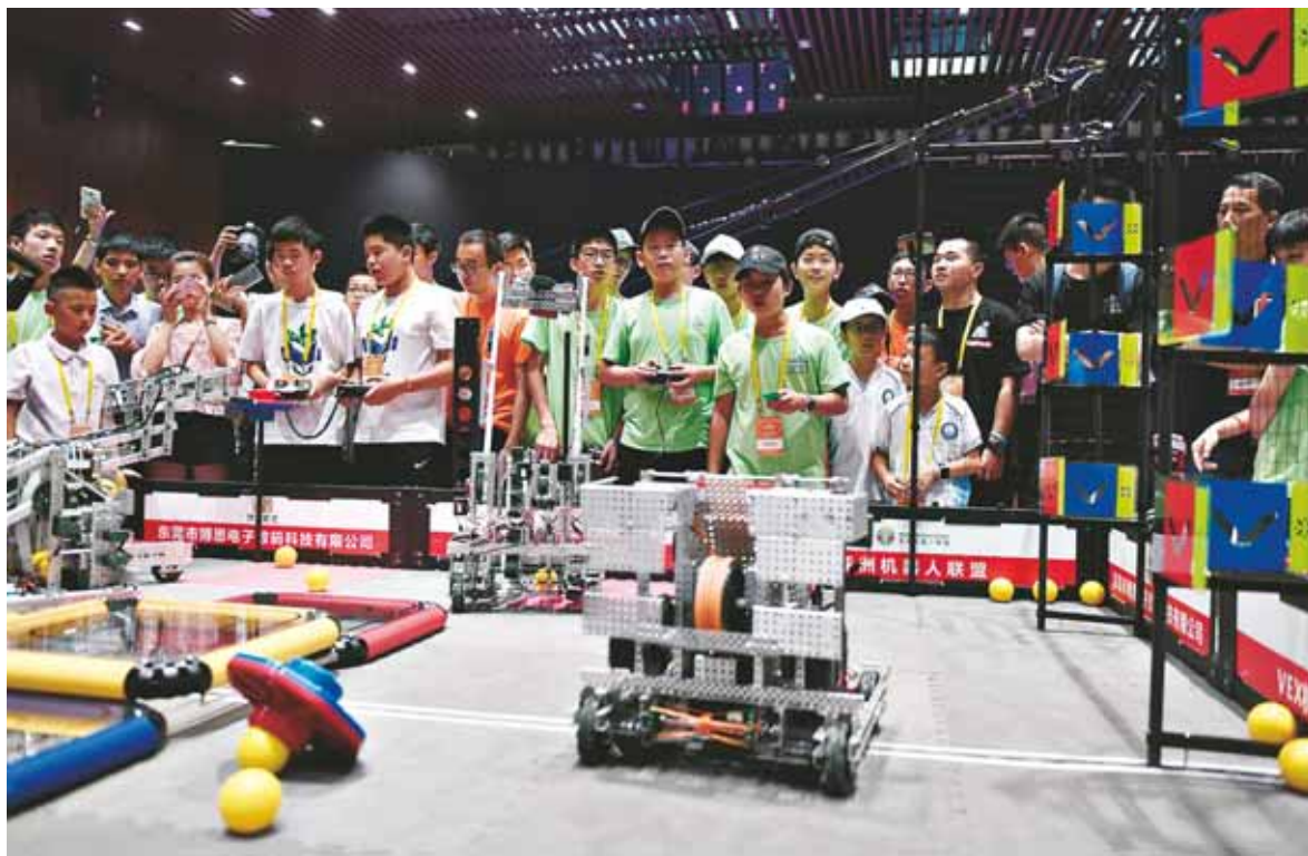
7月11日,2018年全国机器人大赛总决赛在浙江省杭州市萧山机器人小镇拉开帷幕,来自全国各地的4000多名选手将在9个赛项上展开比拼。图为参赛选手在参加机器人工程挑战赛。