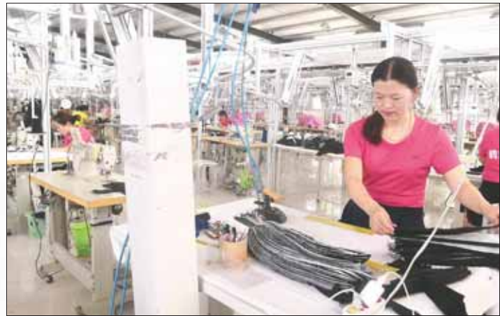
浚县王庄镇井固村产业扶贫基地鹤壁万银服装有限公司内,工人在赶制订单。