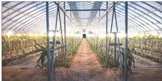
山城区石林镇西酒寺村占地面积约1300平方米的火龙果种植大棚已初具规模。