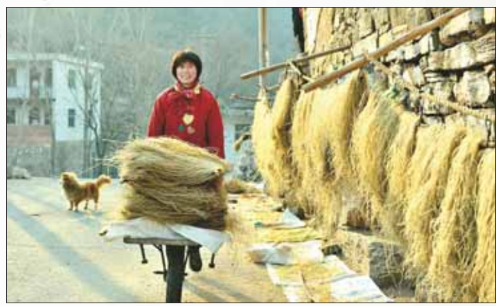
打造特色乡村旅游、培育优质农特产品是鹤山区带动乡村经济发展,提高村民收入的重要举措。图为施家沟村村民在晾晒手工粉条。

八月的鹤城,火热的不仅是天气,还有脱贫攻坚战:满山遍野的光伏电池板,整车待发的外贸服装,挂满枝头的核桃、石榴,养殖场里的山羊、梅花鹿……百花齐放的特色扶贫产业,让越来越多的贫困群众甩掉穷帽子,阔步奔小康。 脱贫攻坚战打响以来,我市紧紧抓住产业扶贫这个“牛鼻子”,因户因人精准施策,打通产业到村到户精准扶贫路。截至2017年年底,已有73个贫困村脱贫摘帽,11718户37966人稳定脱贫。