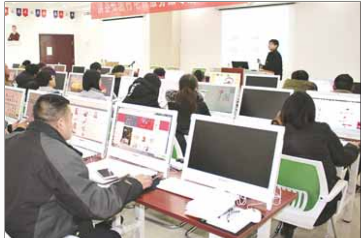
淇县举办电商服务点专题培训班,全县27个贫困村“两委”干部、村级电商服务点负责人、京东淇县特色馆、阿里巴巴淘宝店及电商典型代表等50余人参加了培训。

高质量实现利益联结。 制订了《创新产业扶贫利益联结机制,加强产业扶贫实施方案》,因地制宜,创新实施直接帮扶模式、合作帮扶模式、资产收益模式、社会帮扶模式和项目带动模式,根据贫困户自身条件和脱贫需求,合理选择相应的联结纽带,按照互利共赢的原则,确定贫困户与新型农业经营主体、村集体经济同步增收的股份联结、订单联结、劳务联结、租赁联结等利益分配方式。淇滨区上峪乡桑园村打造的旅游综合体,以股份联结的利益分配方式,年增加村集体经济收入50万元,带动周边3个村400多户贫困户脱贫。