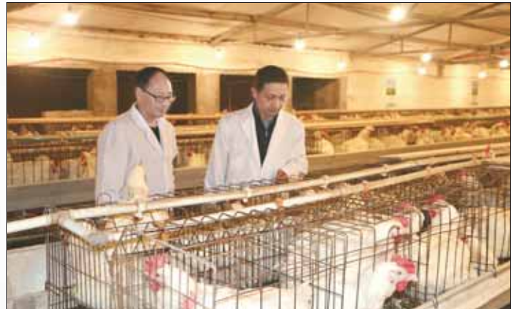
浚县产业扶贫基地奉献禽业有限公司技术人员在鸡舍巡查。

组织+企业+扶贫基地+贫困户”的利益联结体,利用平原地区劳动力资源丰富优势,通过建立“卫星工厂”,实现贫困户就近就业。 ——项目带动模式,让贫困户长期受益。 建立“基层组织+企业+贫困户”的利益联结体,由基层组织成立公司,利用荒坡荒地建造光伏电站,给贫困户分红。