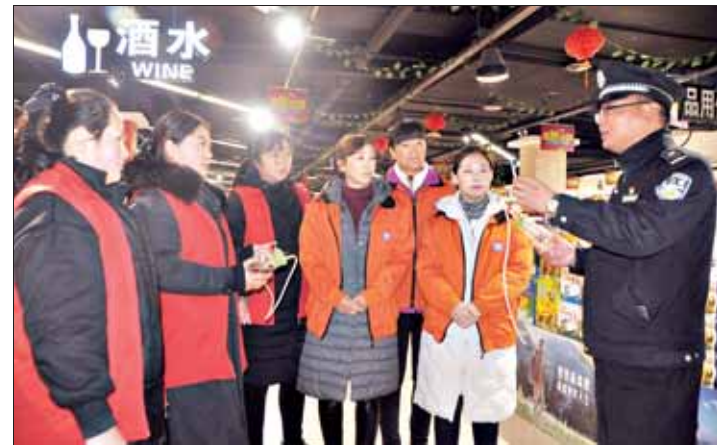
12月6日上午,浚县公安局任山派出所民警深入辖区大型超市、商场等人员集中的公共场所开展禁毒宣传活动,图为民警向超市员工展示吸毒工具、讲解毒品危害。