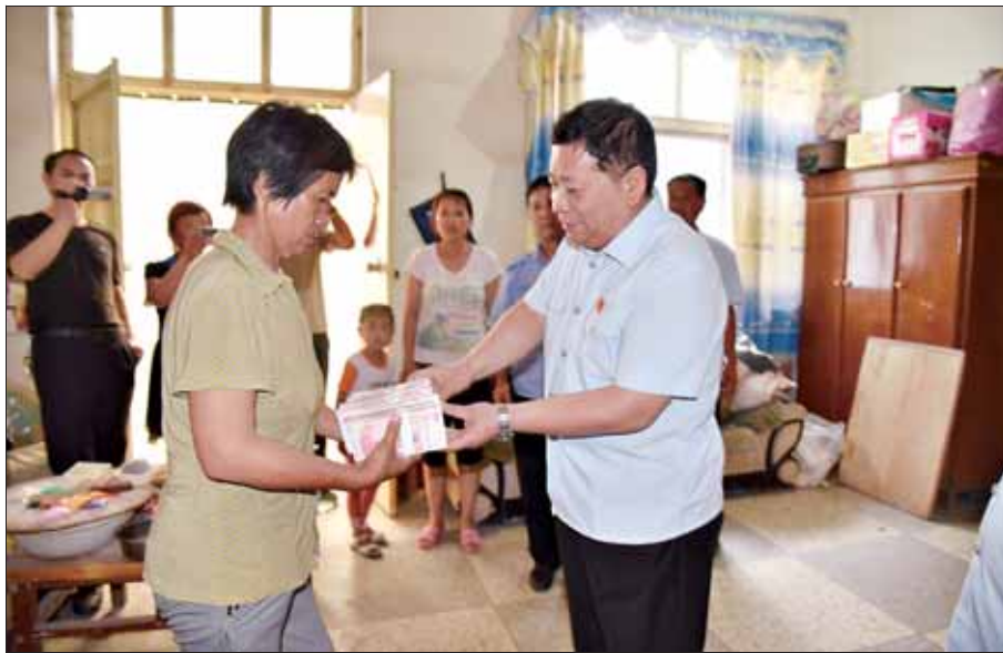
法官给申请执行人送执行赔偿款。