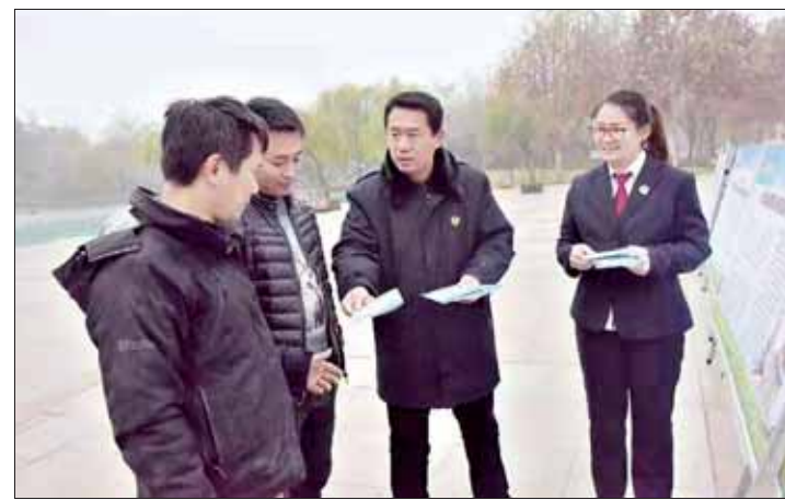
12月1日,市人民检察院、淇滨区人民检察院在新世纪广场开展“以案说法”检察公益诉讼巡展活动。活动中,干警们利用图文展板、公益诉讼宣传手册向群众介绍公益诉讼法律法规及典型案例,并告知举报电话,鼓励群众提供公益诉讼案件线索。

据统计,2016年至2018年10月,浚县人民法院共受理执行案件3305件,执结案件3192件,结案率达96.58%。