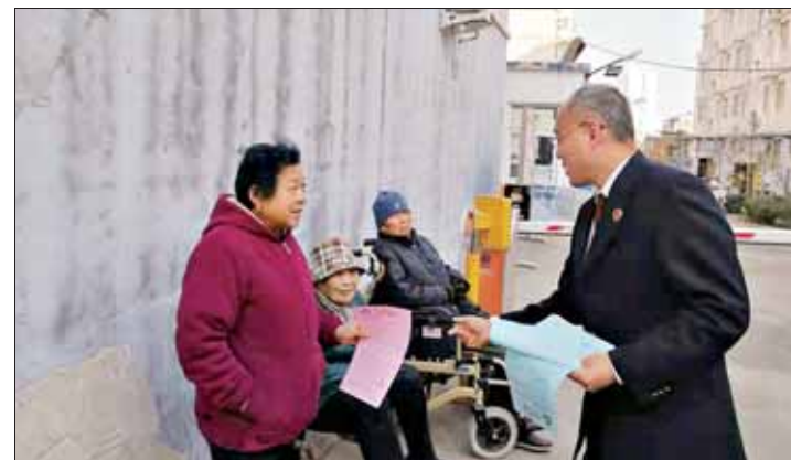
连日来,山城区人民检察院组织干警开展进社区走访活动,及时记录分包社区(村)工作人员和群众意见建议,开展扫黑除恶专项斗争、公众安全感和政法机关执法满意度等宣传、调查工作,提升群众对检察工作的知晓度满意度。