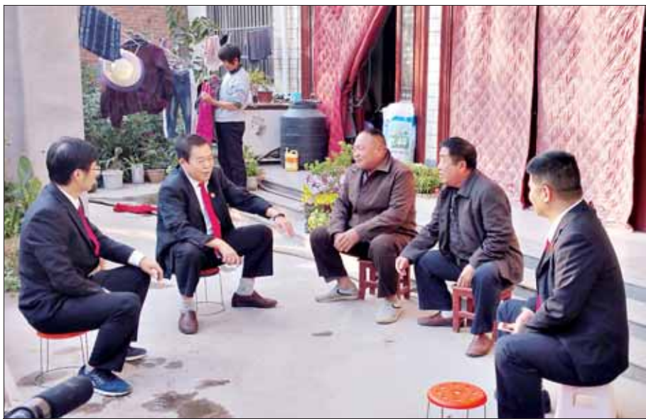
执行干警入村走访做当事人工作。