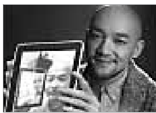
李代沫的“撞脸照”(网友 PS)。