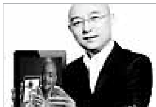
孟非的“撞脸照”(网友 PS)。