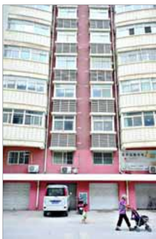
我市某小区内,有些飘窗外安有防护栏,有些则没有。

目前,我市保健食品一般在各药店、医院及各类经营部定点销售。遇到以讲座名义、健康体验等形式进行流动推销保健食品的单位或个人,市民可拨打3328377向市食品药品监督管理局投诉举报。