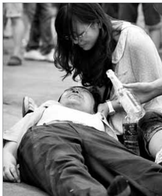
同济大学操场,一名受到踩踏的伤者躺在地上。

20日下午,贝克汉姆一行原计划赴同济大学参加足球互动活动。由于现场观众人数过多,在小贝走进同济大学球场后,现场上千学生涌入球场时引发踩踏,至少5人受伤。