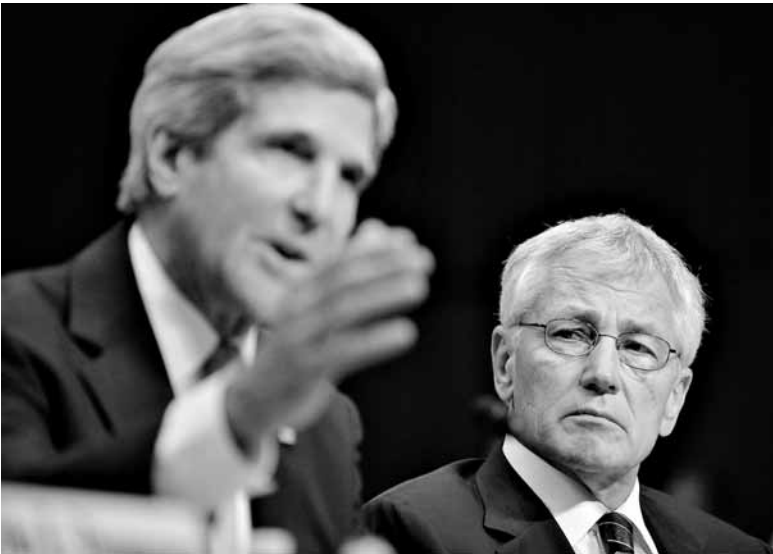
9月3日，在美国首都华盛顿国会山，美国国务卿克里(左)和国防部长哈格尔出席参议院外交关系委员会就对叙利亚采取军事行动举行的听证会。