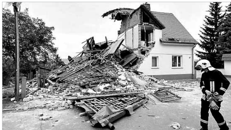
图为爆炸现场被毁的房屋。

据德国《图片报》9月3日报道,德国拉德博伊尔(Radebeul)的一幢2层建筑突然爆炸,房屋大部分化为废墟。然而,居住在其中的9旬老人奇迹般生还。