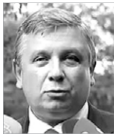
被打者:博罗金 身份:俄罗斯驻荷兰公使参赞 被打时间:10月5日 被打地点:在海牙的外交官公寓 事由:警方称邻居报警博罗金虐待孩子,但俄媒体称此理由为捏造。