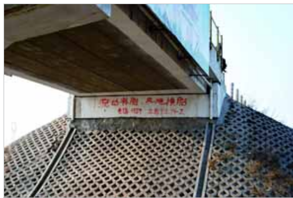
2008年3月11日,山西运城市。