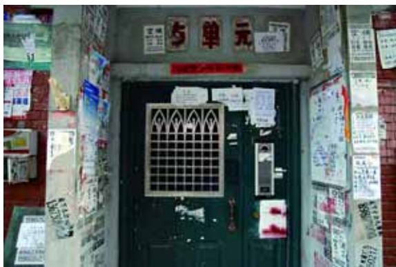
2010年9月7日,北京友谊宾馆宿舍楼。