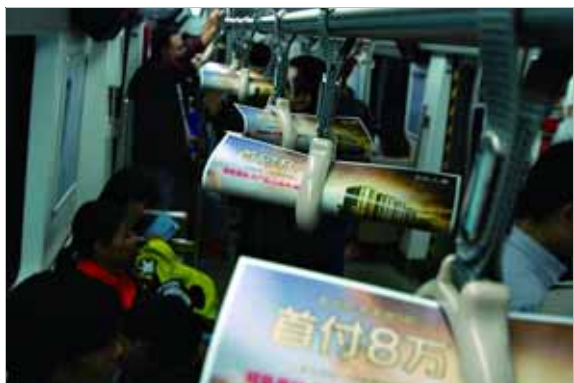
2013年9月25日,北京地铁内。