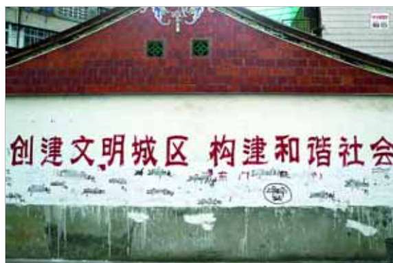
2007年1月5日,福建泉州市。