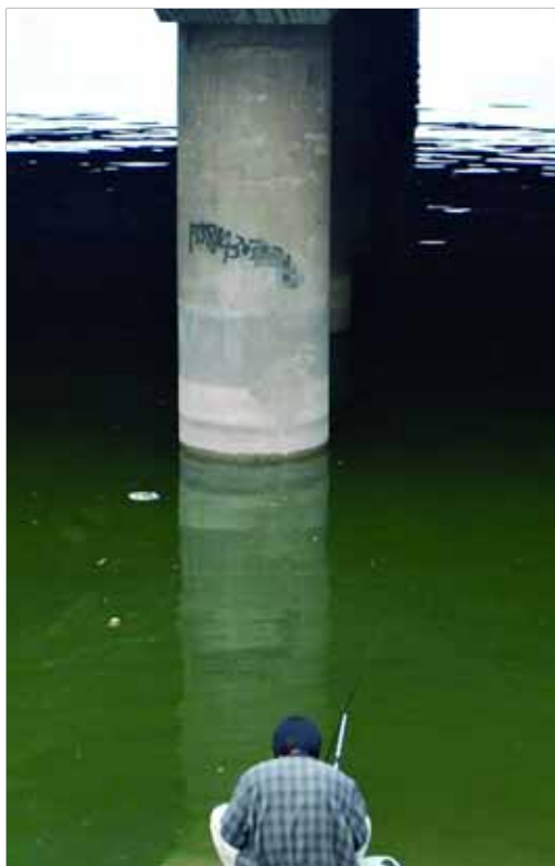
2008年9月8日,北京八一湖。