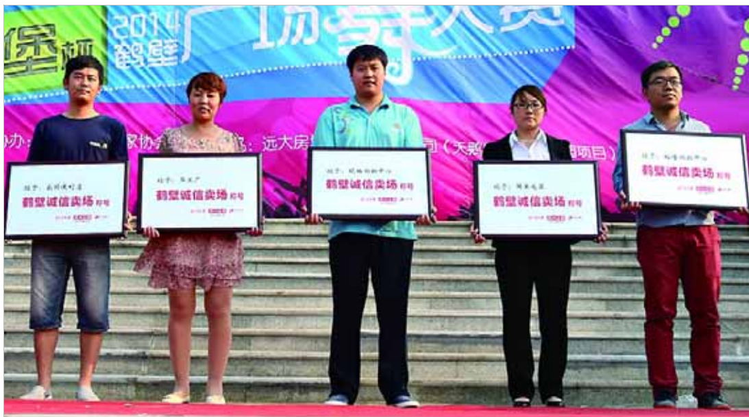
获奖商家代表合影。

5家诚信卖场分别为:裕隆购物中心、萃工厂、国美电器、珉格购物中心、家园便利店。(朱向阳)