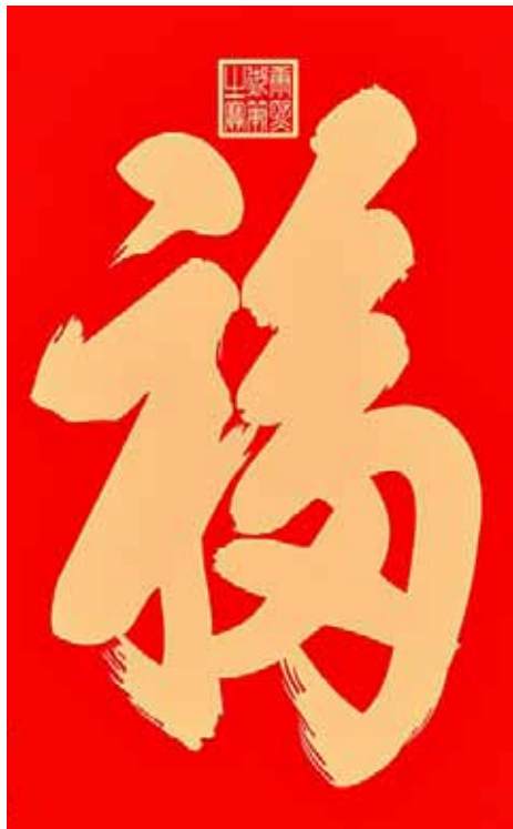
清代康熙皇帝御题的“福”字

贴“福”字时间也有讲究,应在除夕的下午,太阳尚未落山之前,且顺序应该是从外向里贴,先贴抬头“福”,再贴门“福”,以此类推,最后一个才能贴“倒福”,意味着一年的福气都要从外面流进来。