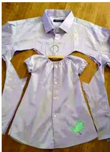
女儿的短裙是爸爸衬衫的一部分。