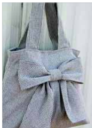
爸爸的衬衫还能改造成包包和抱枕。(据网易)