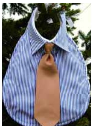
这个围嘴虽然大了点儿,但还是蛮特别的!