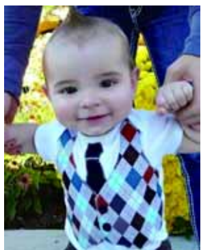
儿子:用爸爸的衬衫改造出的各类服饰,的确够酷!