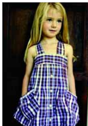
女儿:爸爸,你的衬衫真是为我而生啊,这么多裙子,我都穿不过来了。