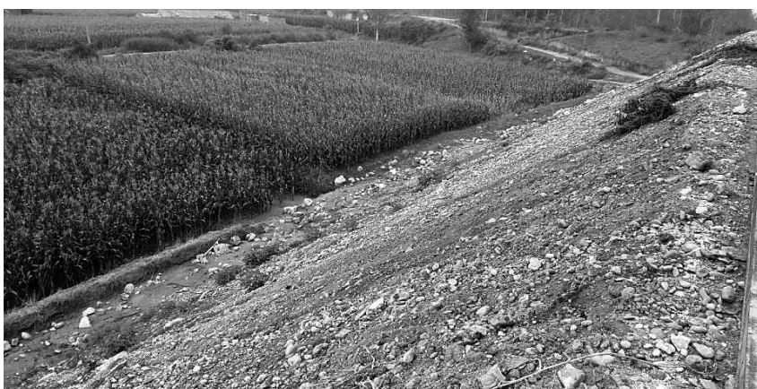
路基没有护坡、排水沟,一下雨就有雨水灌到玉米地里

对此,项目工地的工作人员周先生解释说,目前路基还没有修好,不具备修护坡的条件,“目前正在铺设路基的最后一