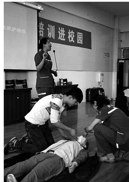
学生体验急救操作