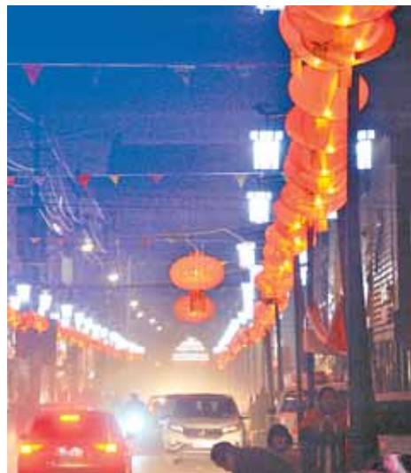
过年期间，浚县街头年味十足