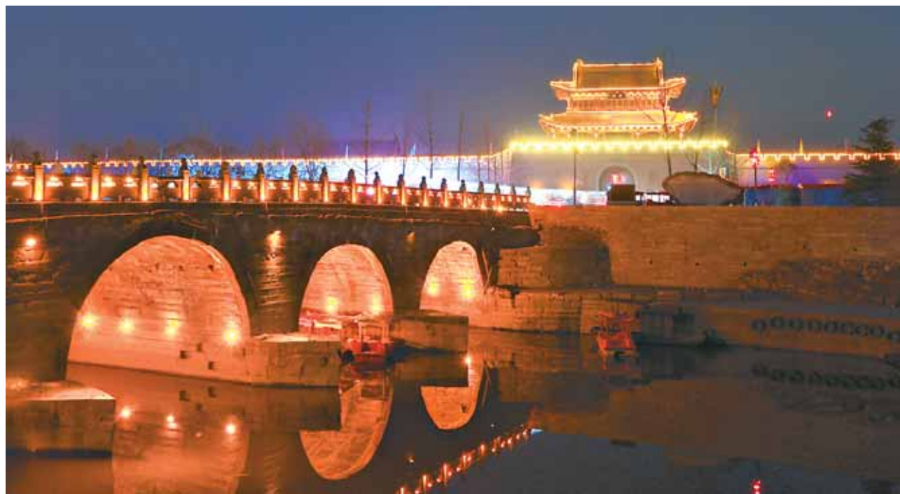
云溪桥夜景