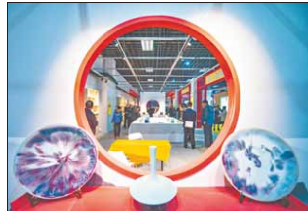
国礼、国宴陶瓷精品展。

本届文博会期间,新中国成立70周年国礼、国宴用瓷展暨生活陶艺展展厅内的精美陶瓷吸引了大量市民和游客观看。“非常感谢文博会,它让我有机会在家门口看到这么多精美的陶瓷。国礼、国宴陶瓷精品真是让我饱了眼福、长了见识。”市民张先生说。