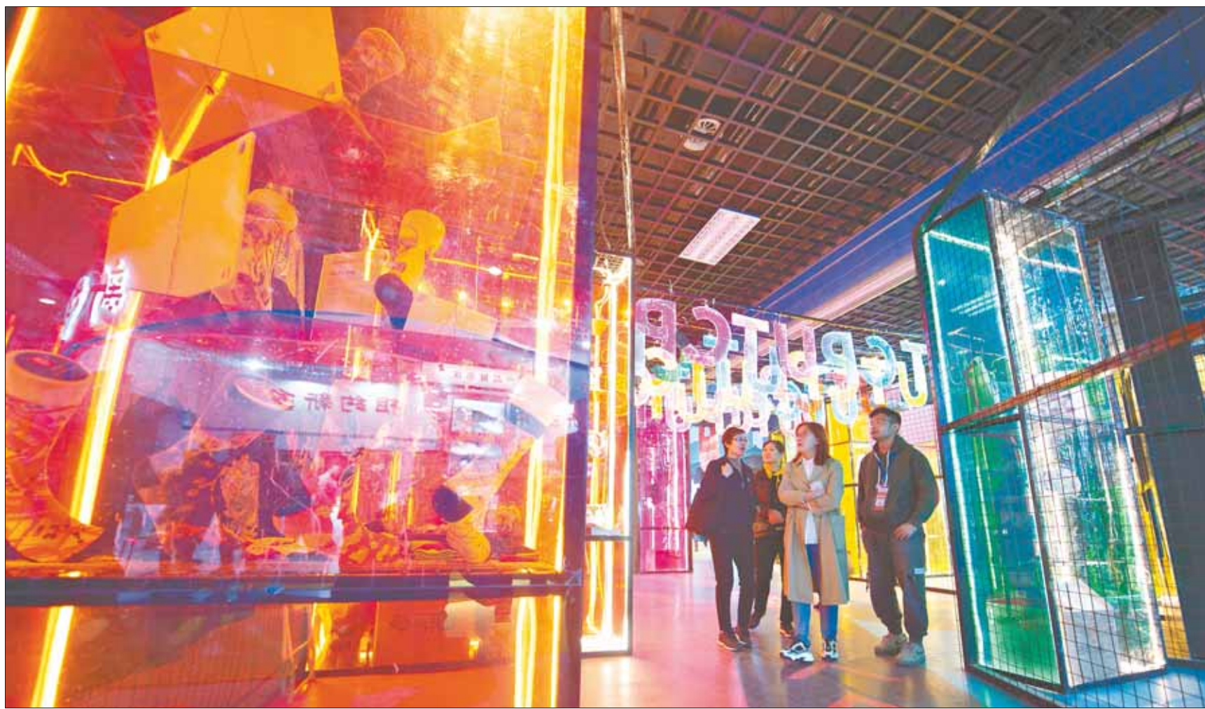
文创IP跨界快闪店20余种设计新颖、造型可爱的文创作品吸引了不少游客驻足观看。