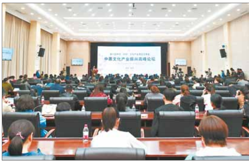
10月18日,中原文化产业振兴高峰论坛在市人民会堂举行。

“文化产业的发展对乡村振兴极为重要,乡村振兴离不开文化产业是不行的。”中国农业大学原校长、教授柯炳生表示,实现乡村振兴的目标和路径离不开文化产业,实现乡村振兴的过程又为文化产业发展提供了广阔的天地。柯炳生还说,鹤壁是一个极具特色的美丽