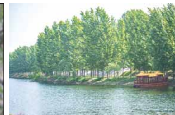
到淇河秦街村段泛舟是件惬意的事。