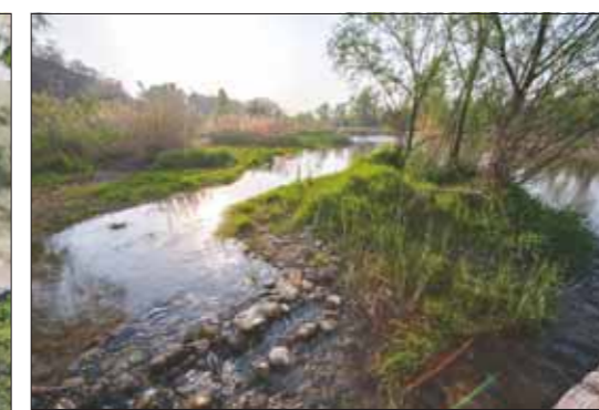
淇河狐仙庙村段的原生态风光。