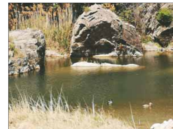
淇河每年都会引来众多水禽在此栖息。