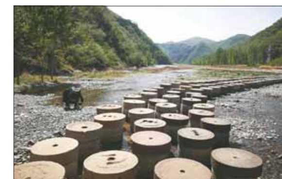
淇河小赵塔村段的河岸步道。