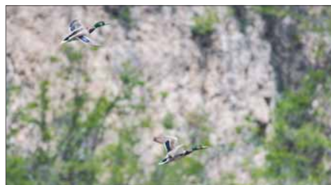
绿头鸭在淇河马家岭村段安家。