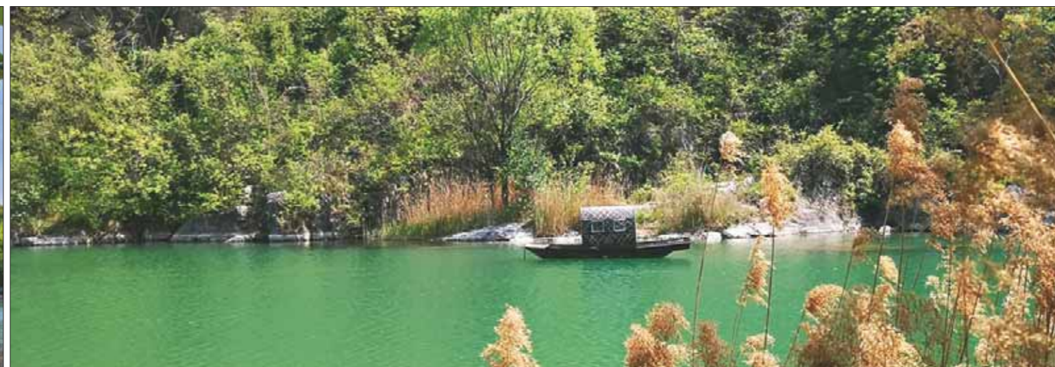
淇河桑园村段吸引了众多游客前去游玩。