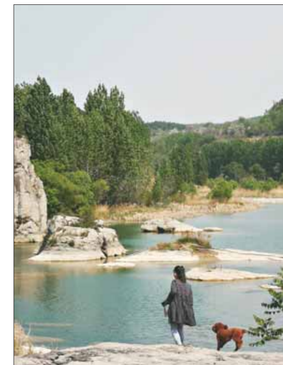
游客在淇河白龙庙村段游玩。