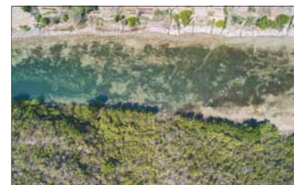
淇河竹园村段河水清澈见底。