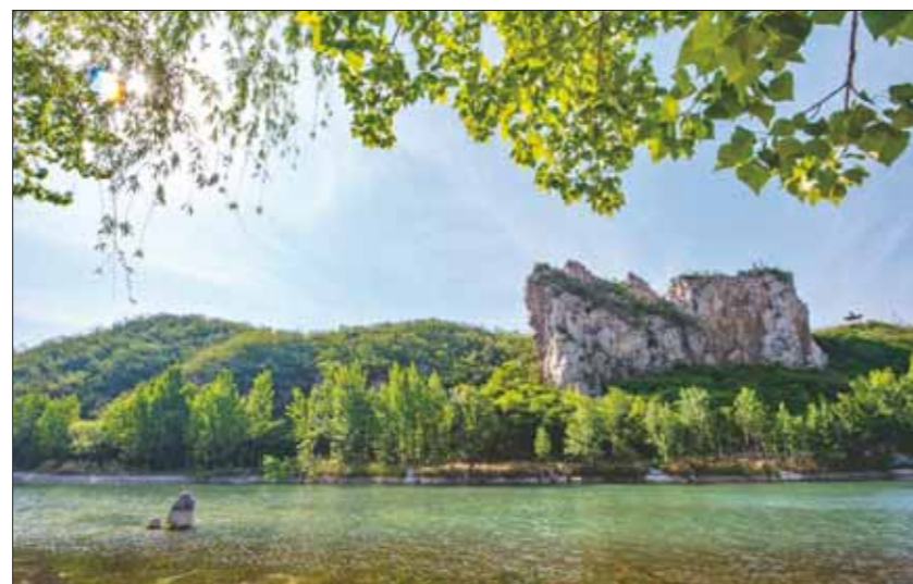
河口村附近的淇河水犹如碧玉。