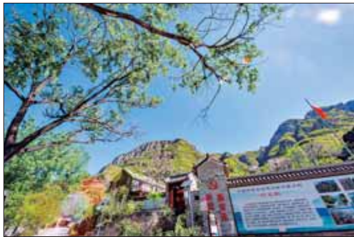
中国传统古村落纣王殿村风景如画。

目前不少史学界人士认为,周武王建立周王朝是在公元前1046年前后,据此,纣王殿村也有3000多年的历史。纣王殿村地处中原地区,特殊地理位置决定了此处是王朝更迭的必争之地。因此,纣王殿村及附近的村落难以逃过战乱之苦,再加上旱灾、蝗灾等自然灾害,纣王殿村的原住民早已消失在历史的长河中。如今纣王殿村的三大姓氏——刘姓、党姓和逯姓均是从外地迁移而来。刘金宝告诉记者:“刘姓和党