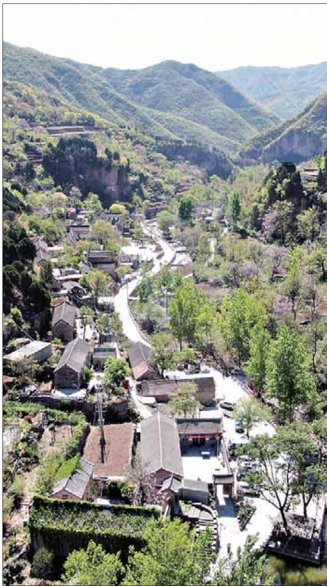
群山掩映中的纣王殿村。

姓是在清末的时候分别从林州市的姚村镇刘家岗村、临淇镇党家岗村迁移过来的,逯姓大概是从林州市牛家岗村迁移过来的。”刘金宝听村里的老人说,祖辈们迁移过来的时候不知道此处叫纣王殿,当时村名叫槐树岸。当年纣王殿村的土地大多归附近西掌村的一个大户人家所有,那家人的子孙不肖,抽鸦片把家产败光了。就这样,纣王殿村的土地成了无主之地,迁居而来的刘姓、党姓和逯姓就在此定居并繁衍生息。