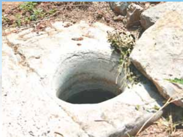
村内随处可见的碓臼。

淇县黄洞乡对寺窑村是个历史悠久的古村落。传闻,明洪武六年(1373年)开始,先后进行了10余次大规模的移民,大量山西移民迁入中原地区,由此便有了对寺窑村。这个古村落在历史上多次避开战乱,如今又因特殊的地形和风光受到游客的青睐。走,随记者进村逛逛吧!