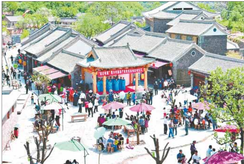
淇县灵山街道赵庄村。