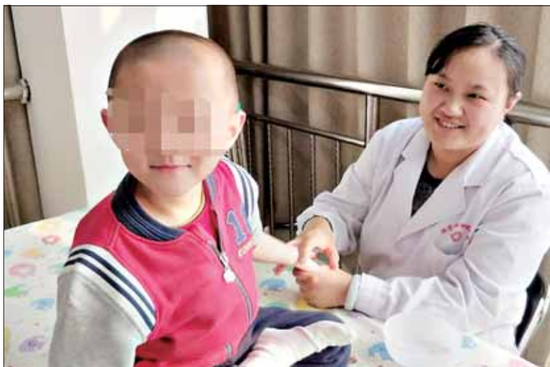
服务暖心，小患者乐意配合治疗。