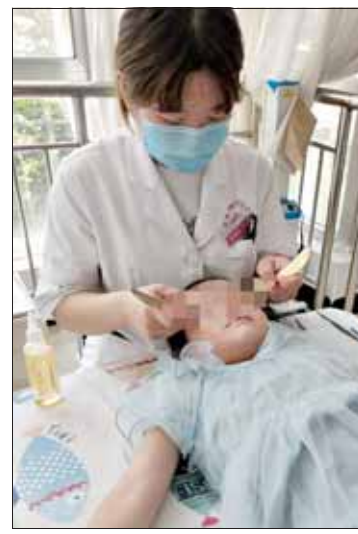
中医手法矫正青少年视力。