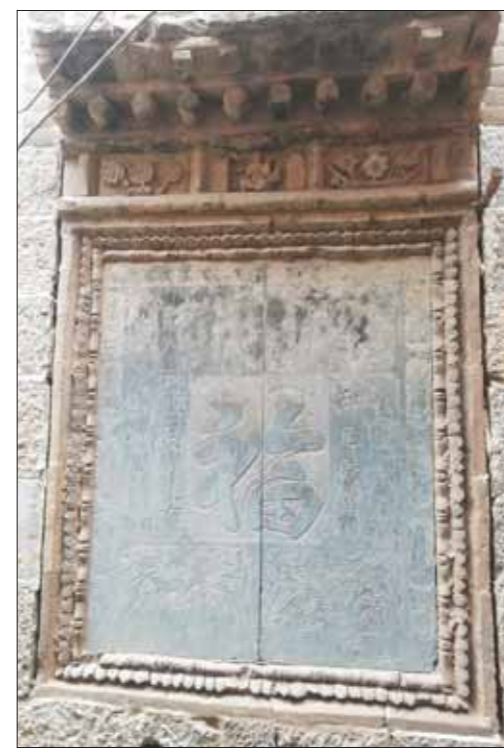
古民居内的影壁墙