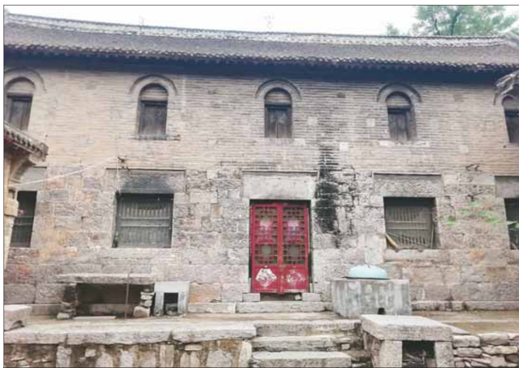
保存完整的古民居