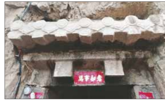
娘娘洞洞口的石檐