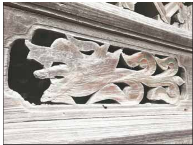
古民居门上的木雕