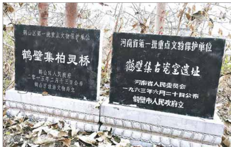
重点文物保护单位标志碑。