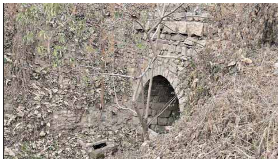
如今的柏灵桥早已失去当年的规模和功能。