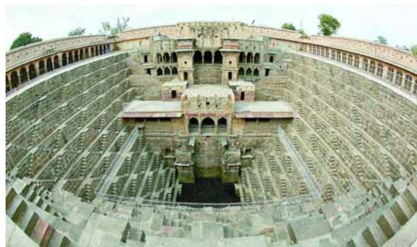
印度拉贾斯坦台阶井建于公元8至9世纪。台阶井的正面有房屋,其余三面共有13层,所有的台阶加起来有3500余级,是印度目前最大、最深的台阶井之一。此井过去被用来储存雨水和乘凉,现已被保护起来,免费向公众开放。

核威慑。实际上,美国逼着朝鲜进行核试验”。早前,朝鲜官方还上传了另外一个视频:纽约市遭导弹攻击后,陷入火海。不过,这个视频由于出自电脑游戏《使命召唤》,涉及版权因素,目前已被删除。朝鲜2月12日进行了第三次核试验,并表示其核试验系针对主要敌人美国。