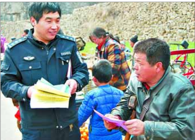
社区民警进行安全知识宣传