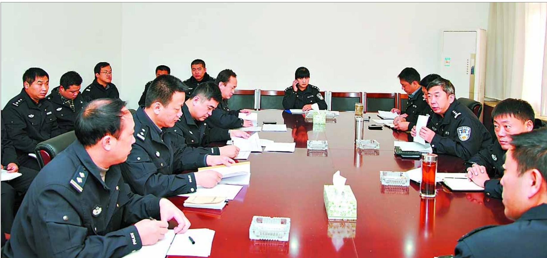
鹤山派出所“打防管控”冬季行动动员会现场