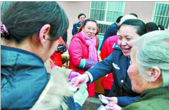
民警向社区居民发放“心防”卡片