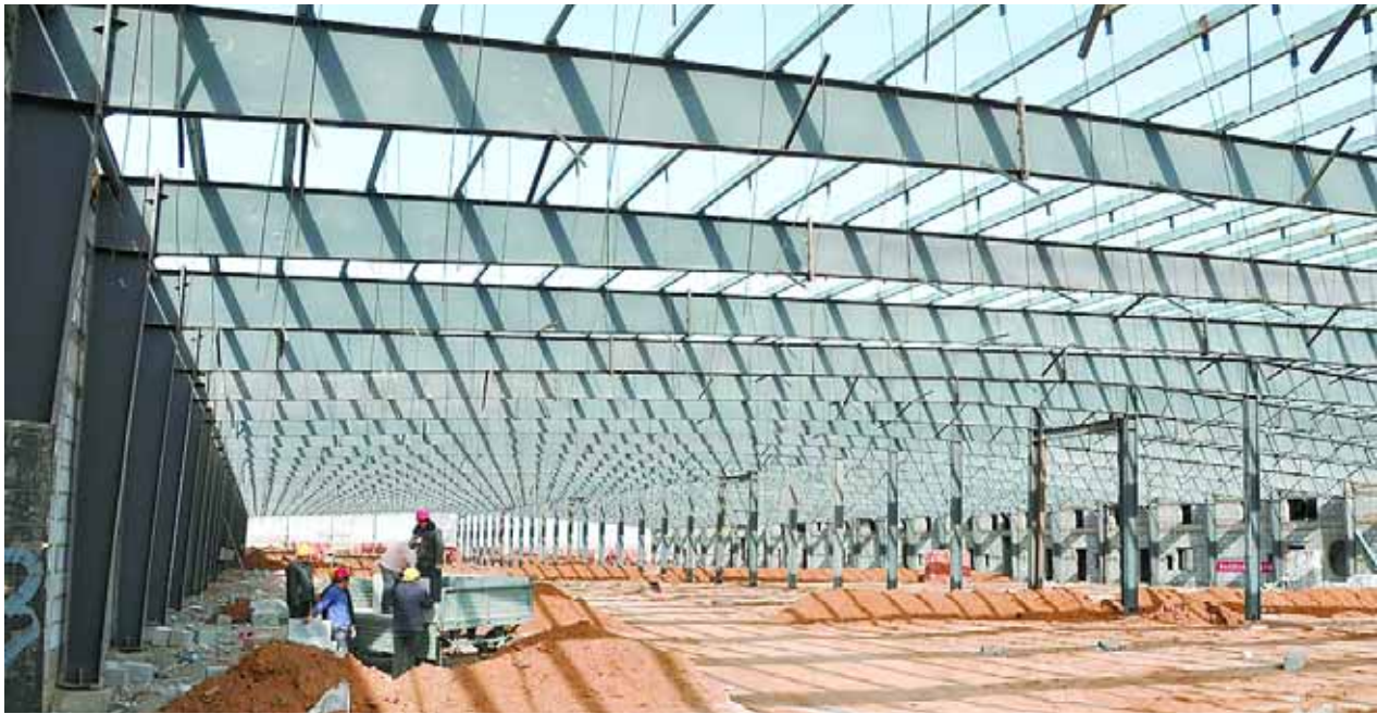
河南强正30万吨纺纱项目位于鹤淇大道中段,总投资7.8亿元,主要建设30万吨纺纱生产线及配套设施。项目建成投产后,年可实现销售收入10.5亿元,利税2亿元。图为近日工人们正在施工。