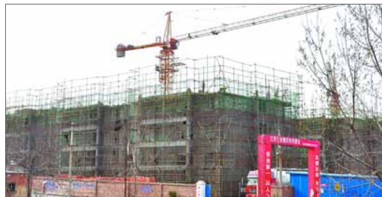
位于鹤山区鹤壁集镇九孔桥的仙鹤花园廉租房项目规划建设住房588套,目前,部分主体施工至4层。

一步做好护林防火工作,减少林区火灾事故的发生,去年防火期前夕,鹤山区林业部门制定了《鹤山区森林防火重点单位和个人奖惩办法》,并请荒山承包户签订了《护林防火承诺书》。每亩一次性交护林防火押金0.5元,以后每年在防火期内未发生火灾的,每亩继续按1元奖励。以此激发承包荒山农户看好山、护好林的热情。办法实施以来,鹤山区林区火灾事故明显减少。(张旭 王贵福)