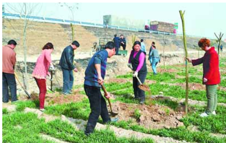
连日来,淇县大力推进通道造林绿化工作。截至目前,全县已完成通道绿化60余公里,栽植大叶女贞、法桐、杨树等各类苗木30余万株。