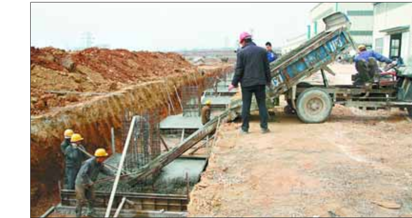
鹤壁市鹤钢铸造有限公司年产3万吨精加工机械铸件项目自2月底开工以来,进展顺利。目前,该项目正在进行基础施工。

本报讯 3月15日上午,由鹤山区文化馆主办的首届鹤山区寻找鹤山好声音大型音乐秀启动仪式在鹤山区中心幼儿园多功能音乐厅举行。启动仪式后,海选第一场30名参赛选手抽取上场顺序,依序入场,比赛紧张进行。无论流行乐或是民族风,选手们全情投入,赢得了现场观众的阵阵掌声,台上选手们纵情歌唱,台下专业评委认真点评。参赛选手用歌声点燃激情,展示了新时代鹤山人积极向上的精神风貌。寻找鹤山好声音将为鹤山区群众提供一个展示自我风采的舞台,也将成为鹤山人展示新活力、唱响新生活、展现鹤山时代精神风貌的一个重要平台。通过比赛发掘和培养一批歌唱人才,促进该