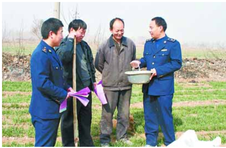
连日来,淇县工商局执法人员深入田间地头,向农民宣传购买农资注意事项、识辨假冒农资常识,切实保护农民的合法权益。