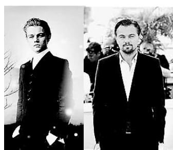
莱昂纳多·迪卡普里奥