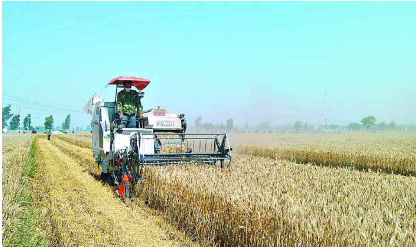
6月12日上午,淇滨区钜桥镇刘寨万亩小麦核心示范片的小麦正在收割。随着天气好转,我市群众抓住天气晴好的有利时机抢收小麦,截至当日,已收割小麦89.5万亩,预计到6月16日我市130余万亩小麦可基本收割完毕。

结出了行政推动保障、良种研发推广、技术集成融合、标准规范生产、信息引领服务等一整套整建制推进粮食高产创建的新模式,树立了一个很好的样板,验收组建议在全省乃至全国同类地区推广,以提升粮食高产创建水平,为保障国家粮食安全再做新贡献。”国家小麦工程技术研究中心主任、农业部小麦专家指导组组长郭天财在接受记者采访时表示。