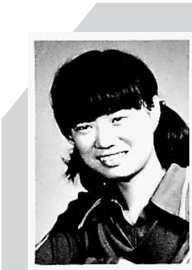
学生时代的邓文迪。