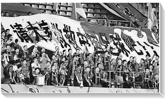
6月16日,球迷悬挂在中超赛场上的标语。

6月15日晚,中国国家男子足球队在主场合肥奥体中心1:5不敌泰国队,惨遭热身赛三连败并创下输给泰国队的一个纪录,被指“拿国家形象开国际玩笑”。