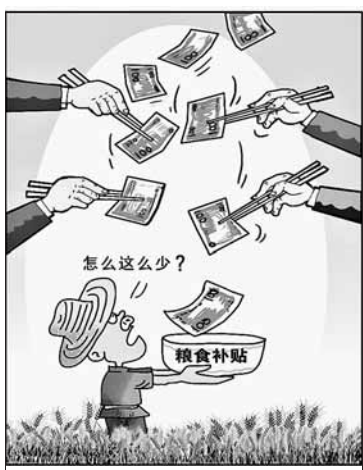
地方为经济发展,对耕地侵占十分严重。虽然每年中央拨款缓解粮食主产区地方政府的财政困难,但专家调查称每年给产粮县8000万元补贴被盘剥到县只剩1000万元。 截留 朱慧卿 作