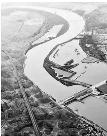
母亲河黄河在初入宁夏后,途经中卫市黑山峡,近百公里河道两侧高山林立、河床狭窄、水势湍急,峡谷内怪石密集,十分壮观。图为黄河宁夏中卫段河面蜿蜒曲折(6月29日摄)。