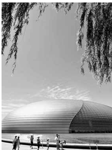
7月1日一夜的暴雨冲走了连日的雾霾,北京碧空如洗,阳光灿烂。图为7月2日,游客在国家大剧院外游玩。