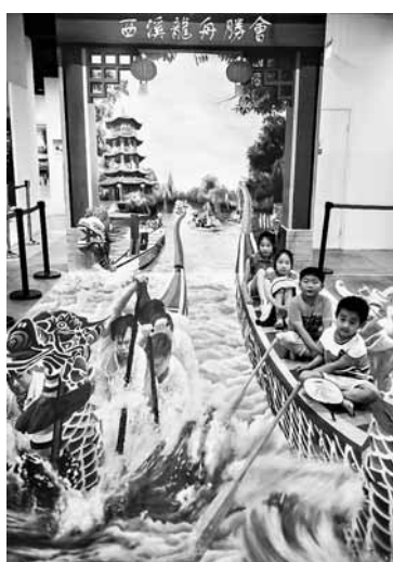
暑假伊始,杭州市文天社区为社区里来自各地的“小候鸟”们开办了暑期才艺课堂,免费举办包括学做陶艺、书画、剪纸、家务、唱红歌以及参观博物馆等活动。 7月2日,孩子们在3D立体画赛龙舟前合影。