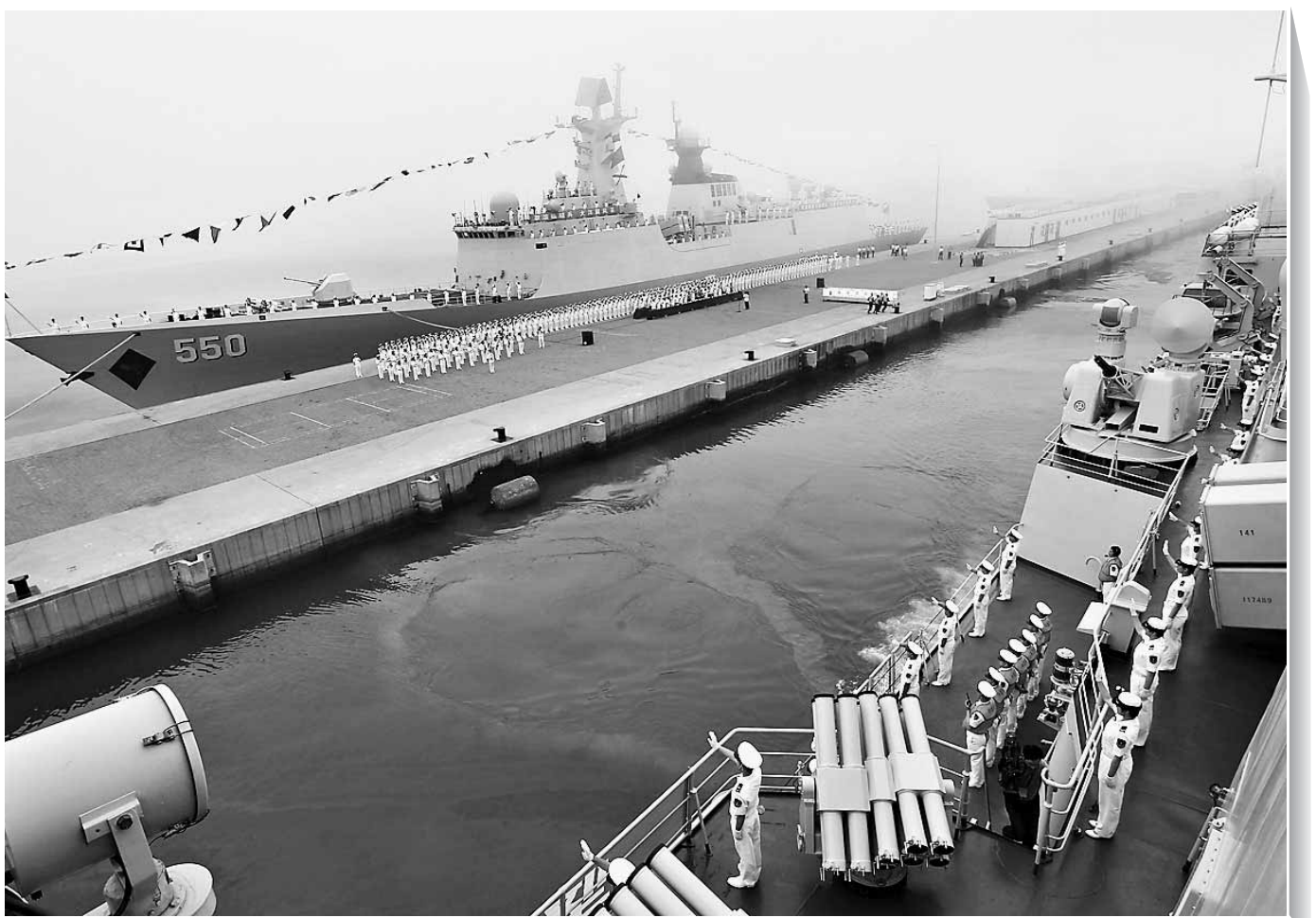
7月1日,沈阳舰在大雾中徐徐驶离青岛某军港。 当日,由4艘驱逐舰、2艘护卫舰和1艘综合补给舰组成的中国海军舰艇编队从青岛起航赴俄罗斯参加中俄“海上联合—2013”军事演习。这是中国海军首次组织大规模远海基地,在无保障体系依托情况下,在他国境内参加的联合演习。

山东大学高等教育研究中心副主任刘志业认为,高考制度改革一直在理想与现实的夹缝中前行。就目前来讲,高考改革应遵循“稳中求进”原则,一方面不能急于求成,试图一步到位,那样有可能造成混乱,另一方面,应在坚持改革方向不变的前提下,努力解决现实的不利因素,而不是在现实困境前不思进取,更不能开历史的倒车。 (据新华社济南7月2日电)