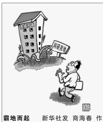
支付低廉的土地出让金从政府手中拿的科研用地,后“变身”成住宅高价卖给购房者。 近些年,北京时常发生这种违规行为,并引起购房者与开发者的纠纷。北京市国土局昨日公布,查出9宗科研项目用地涉嫌未经批准擅自改变用途或违规销售行为,目前正在核查处理。 霸地而起 新华社发 商海春 作