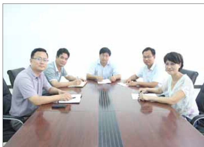
医院领导班子成员合影。

新的起点,新的征程,淇县人民医院将秉承“严谨、创新、和谐、奉献”的院训,奋发图强,乘势而上,立足一方水土,润泽一方百姓,为鹤壁市卫生事业的发展增光添彩。