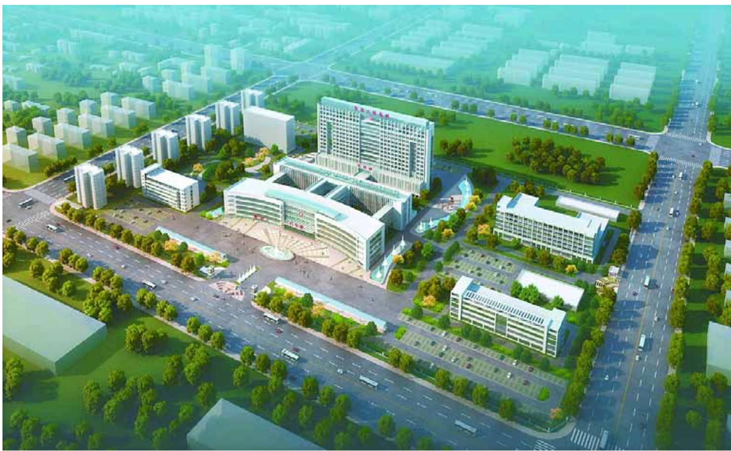
淇县人民医院新址效果图

如今,淇县人民医院占地面积200亩,医疗业务用房建筑面积8万余平方米,开设有26个临床病区、40余个门诊医技科室、15个职能科室,建立了功能设施较为先进的ICU、CCU、NICU、PICU等重症监护病区。医院设置床位800张,现有在职职工820人,其中专业技术人员712人(含高、中、初级职称215人)。拥有西门子磁共振、西门子64排螺旋CT、日立全自动生化分析仪、直线加速器、GE四维彩超、飞利浦DR(数字X光摄影系统)、数字胃肠诊断机、电子胃镜、高压氧舱、腹腔镜、血液透析机、中央监护系统等先