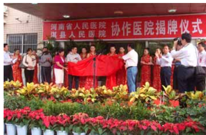
与省人民医院结为协作医院。