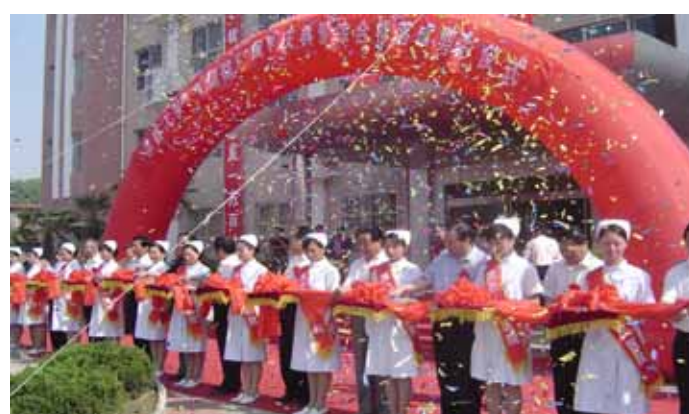
举行建院60周年庆典。