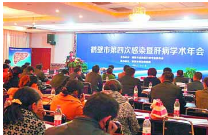
市传染病医院积极承办全市感染暨肝病学术年会。(资料图片)