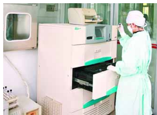
工作人员操作BD960全自动快速分枝杆菌培养仪。

保险的职工和参加新型农村合作医疗的农民,以及无姓名、无住址、无陪护人的三无患者。 具体流程是,接诊医生与符合条件的患者签订《患者住院费用结算协议书》(简称《协议书》),患者持《协议书》到医保科审核,并将医保证和新农合证复印件、户口簿、患者及一名直系亲属的身份证复印件交