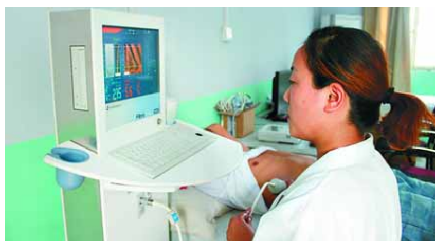
工作人员使用肝硬度检测仪为患者检测。