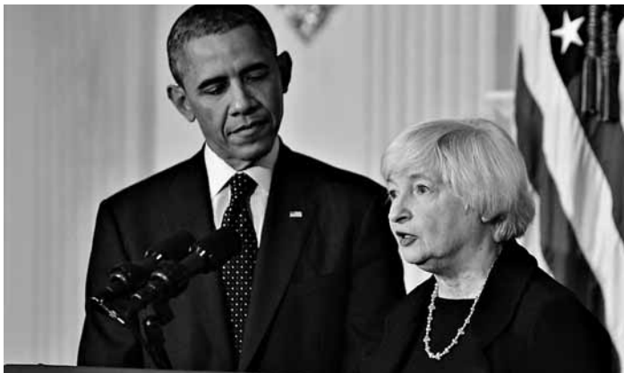
10月9日,美国总统奥巴马(左)和现任美联储副主席珍妮特·耶伦在华盛顿白宫出席提名会。

据新华社华盛顿10月9日电(记者 樊宇 蒋旭峰)美国总统奥巴马9日宣布,提名美国联邦储备委员会现任副主席珍妮特·耶伦接替伯南克出任美联储下一任主席。