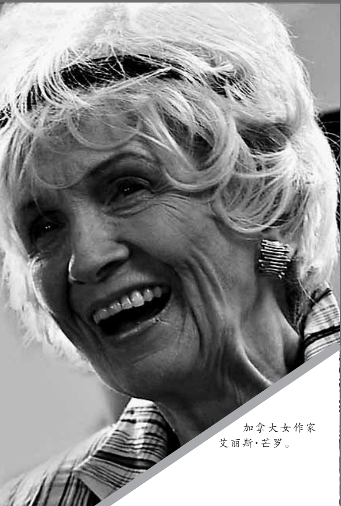
加拿大女作家艾丽斯·芒罗。