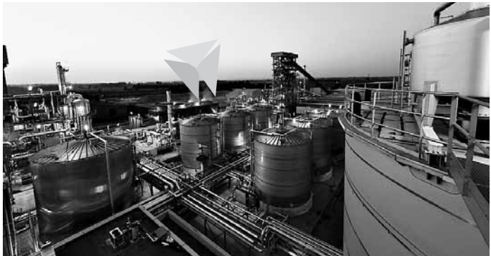
工厂外景的资料照片。

据新华社意大利克雷申蒂诺9月10日电 全球首个以秸秆为原料生产纤维素乙醇的工业化装置10月9日在意大利北部克雷申蒂诺市启动。