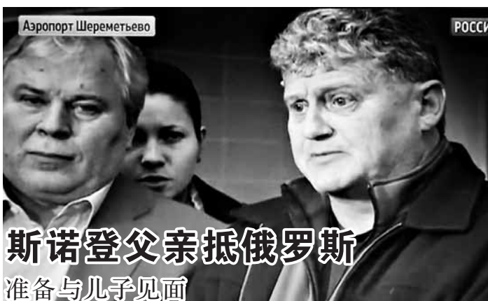
斯诺登父亲抵俄罗斯准备与儿子见面。

上的高产能作物芦竹为原料,先进行预处理、之后添加酶制剂,将物质中的纤维素和半纤维素转化成糖,经过发酵得到乙醇。生产过程的副产品木质素还可用于发电,不仅可以满足这家示范厂生产所需的能源消耗,剩余的绿色电力还可出售给当地电网。