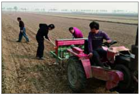
连日来,浚县驻村工作队深入田间地头帮助群众收秋种麦,受到群众好评。图为10月9日上午,浚县卫生局驻村队员帮助新镇镇林庄村村民播种小麦。