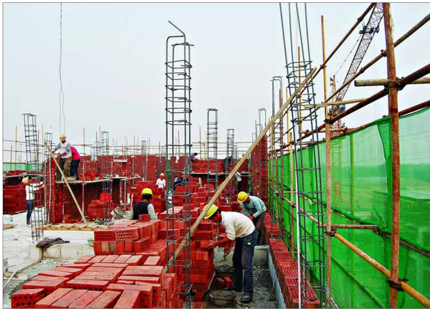
今年以来,浚县强化服务,不断加大项目建设力度,一大批重点项目得到快速推进。图为10月9日,位于浚县产业集聚区内的聆海整体家居项目综合楼正在施工。