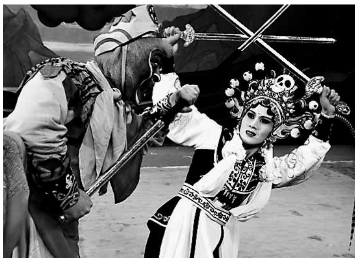
绍剧《孙悟空三打白骨精》剧照。