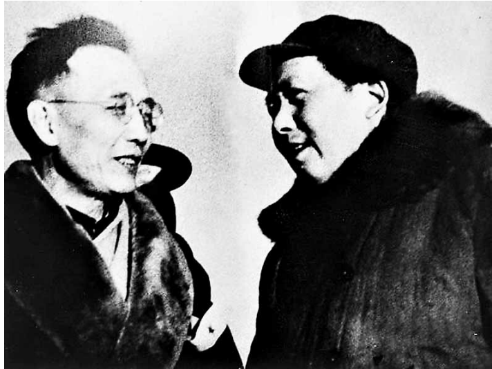
毛泽东(右)与郭沫若。

在领导中国革命和社会主义建设的长河中,毛泽东一贯非常重视的各项政策和策略。在读《西游记》这部小说中的一个个神话故事时,他也非常注意从政策