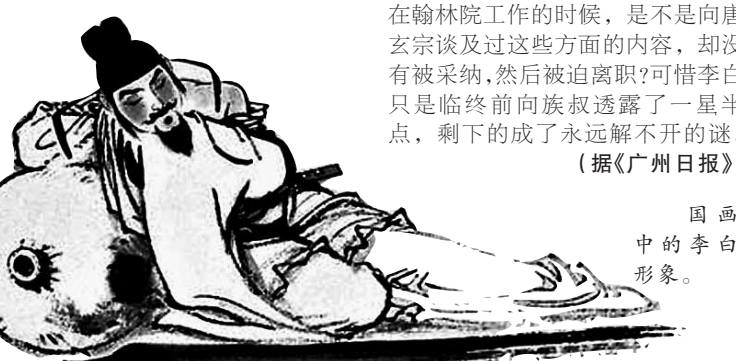
国画中的李白形象。

李白老师上班的具体地点在大明宫右银台门内,一大早去办公室,首先能看到办公大楼的顶上写着“翰林之门”,大门东向。如果将这栋办公大楼跟政治中心——大明宫联系起来,你就知道李白老师上班的地方有多重要了——它处于大明