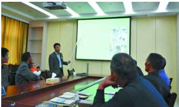
10月13日至19日,在全国“服务百姓健康行动”大型义诊活动中,淇县人民医院组织专家积极行动起来,走街头、进社区、下基层热心服务群众。图为义诊人员走进阳光社区举办健康讲座。

此次评议范围包括行政执法部门、服务行业、窗口单位和11个乡镇街道办及产业集聚区建管办,共72个单位。评议内容包括机关作风、机关管理、服务群众、办事效率、工作态度、法纪绩效情况等6个方面。采用了直评评议与民主监督相结合的形式,从企业负责人、个体工商户、人大代表、政协委员中选出计票员和监督人员现场计票,县电视台全程录像。本次评议细化了评议计分办法,在“满意”、“基本满意”、“不满意”、“不了解”等次上设置相应分值,扣除今年以来作风纪律检查被通报批评及其他处理的适当减分,最终得出评议得分。根据得分多少排出名次,对综合得分前10名和后10名的单位分别进行通报表扬和批评,对综合得分后3名的单位党政一把手诫勉谈话;对综合得分末位的单位党政班子集体诫勉谈话;对公共服务行业中综合得分前3名和后3名的单位分别进行通报表扬和批评。(陈慧波)