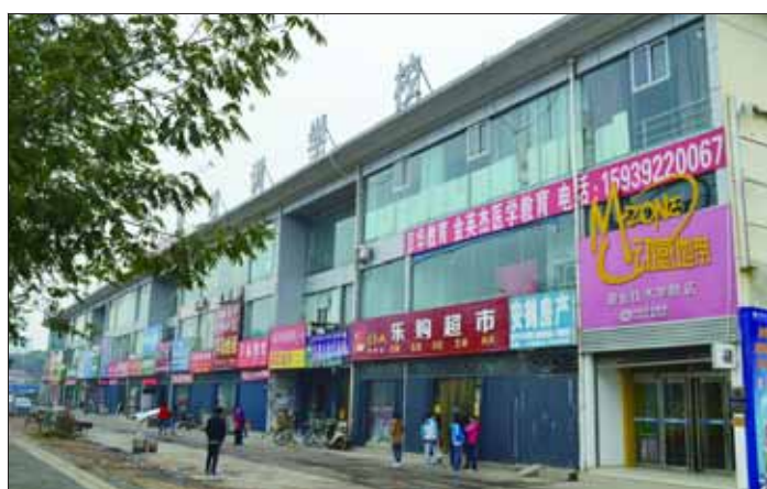
四季青集团旗下临街商务办公楼。