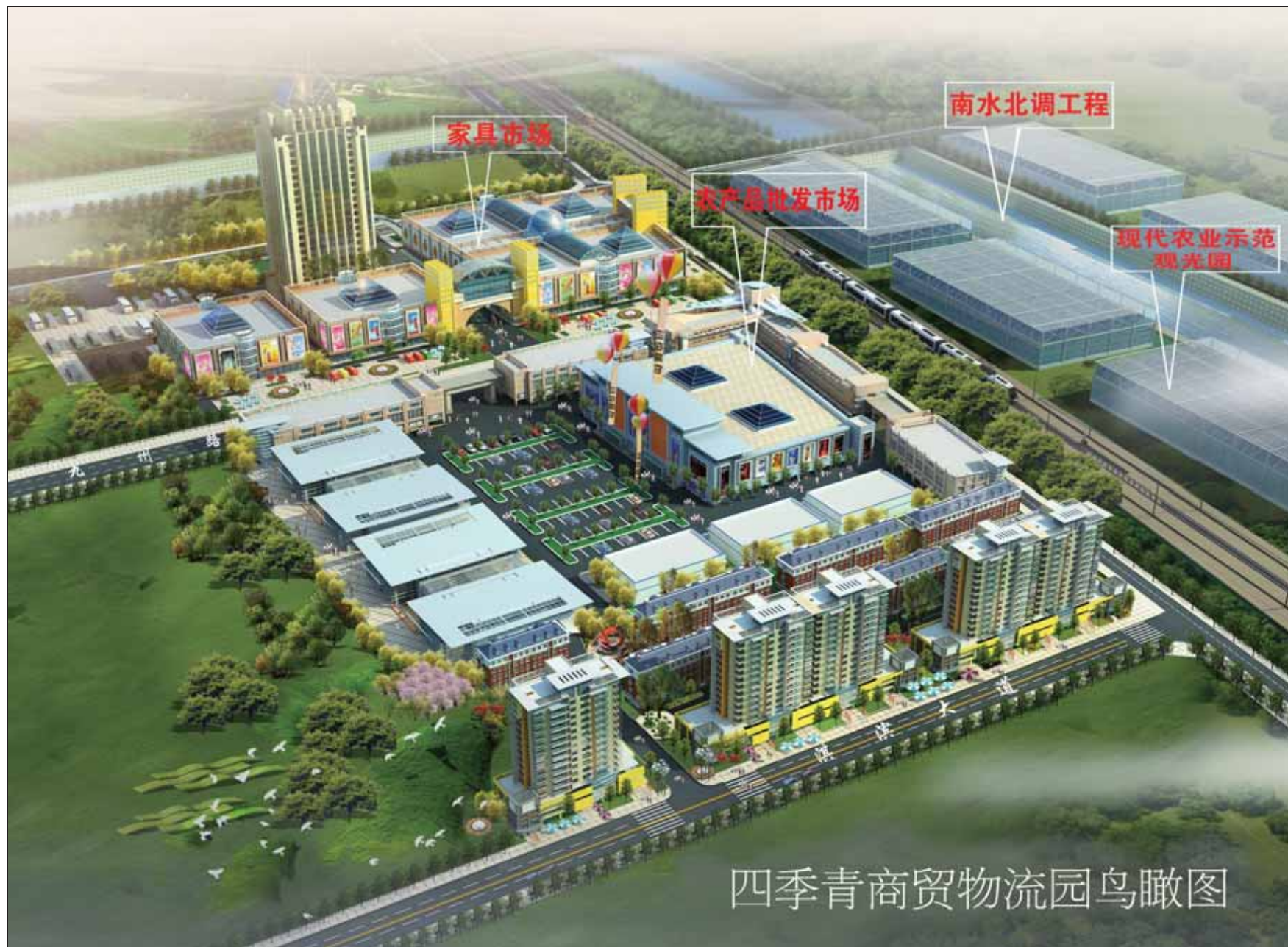
四季青商贸物流园鸟瞰图

其次,必须立足现有优势和基础,着力在做大、做强、做优、做全、做活上下功夫。“做大”不是做成大而全、小而全的发展格局,而是要针对当前商贸物流业发展散、小、乱现状,提升档次,推进产业集聚、集群发展,形成规模效应。再次,要站在全局考虑问题。“不谋全