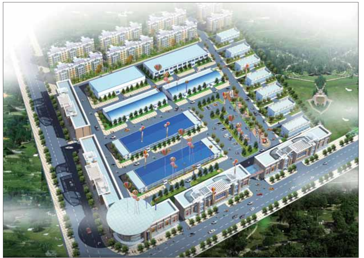
鹤壁市四季青农产品批发市场鸟瞰图。