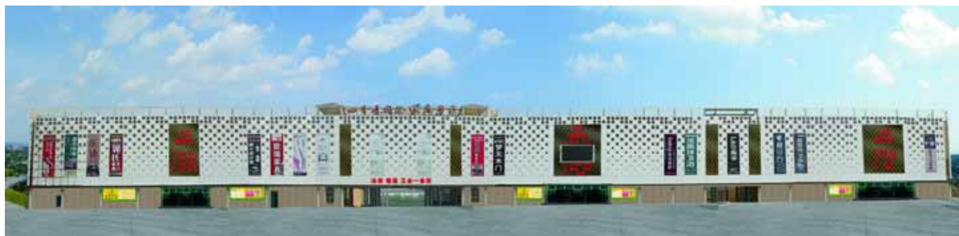
鹤壁最大的家具建材卖场四季青国际家具广场。