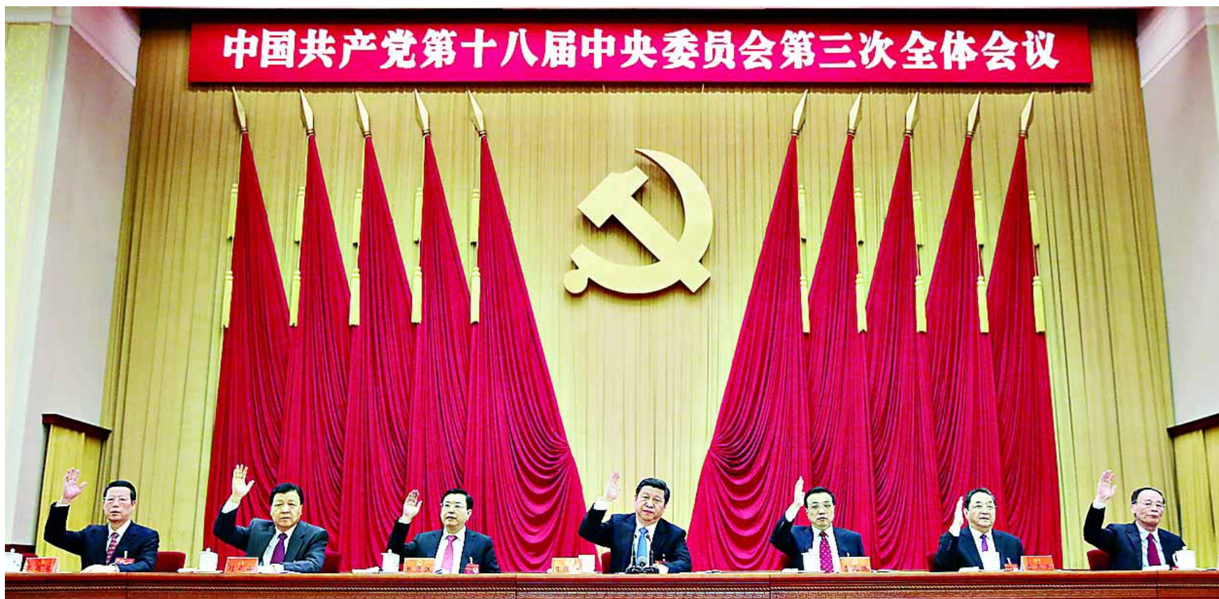
习近平、李克强、张德江、俞正声、刘云山、王岐山、张高丽等在主席台上。