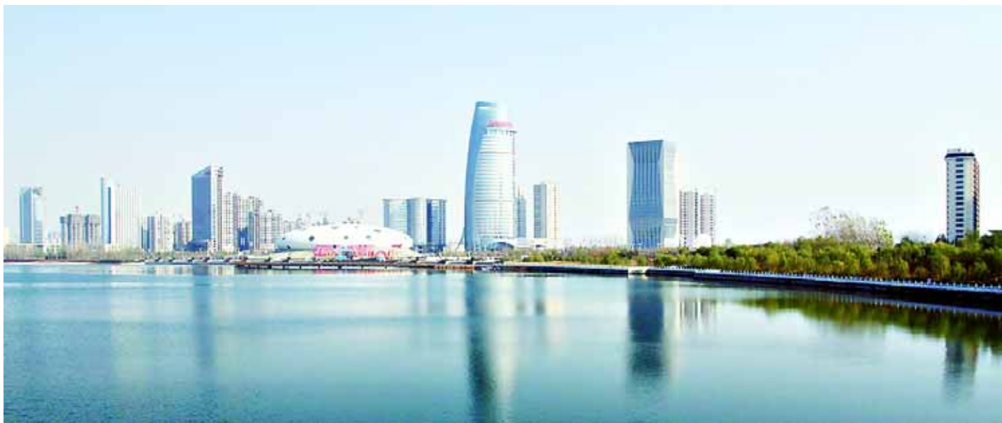
目前,市商务中心区十大标志性建筑全部满足招商条件。其中,金融大厦、莲鹤大厦、会展中心、观景大厦、玉大厦、光明大厦已建成投入使用,入驻企业30多家,签约100多家,正在洽谈的50多家,签约面积50%以上。图为11月27日,市商务中心区一景。

近几年来,大赉店镇每年都会开展入村普法宣传教育活动,重点针对农民防范意识差、法律意识淡薄等现象,开展相关法律法规知识的宣传和讲解,为农民提供法律咨询和援助。据了解,这次活动将在该镇20个村庄逐一开展,全面普及。(赵雷)