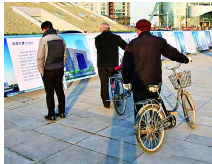
11月29日,在市会展中心广场上,人们驻足观看市商务中心区建设情况展板。在镁博会期间,淇滨区通过展板、实地讲解等多种形式宣传市商务中心区的建设概况及企业入驻情况。孙伟民 摄

目前,淇滨区已完成漓江路中段、珠江路中段、天山西支路南段等16条(段)7.7公里的城市道路建设,为拓展城市框架,扩大招商引资,加快项目建设提供了硬件支持。(薛山)