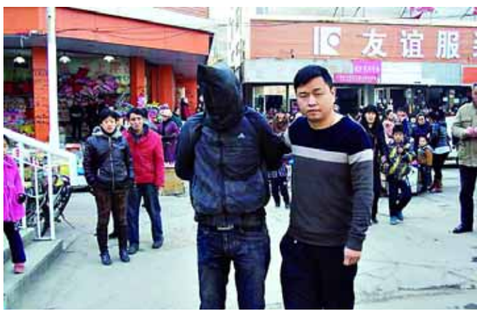
红旗派出所便衣民警抓获一名街头扒窃者