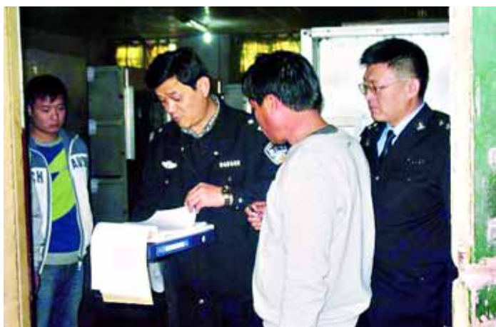
红旗派出所民警在检查旅馆住宿登记情况