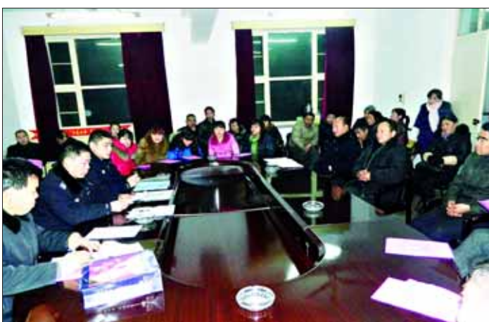
红旗派出所举办运输业业主及司乘人员安全培训班