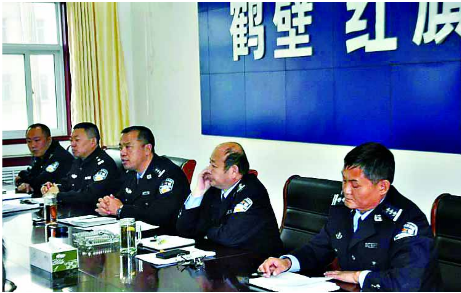
红旗派出所案情研判会议现场

强队伍凝聚力,挖掘全体民警的潜能和创造性,充分发挥现有警力的最大效能。为此,他们于11月29日召开大会,对各基层单位的20名先进民警进行了通报奖励,通过树立榜样,发挥典型的激励、示范和导向作用,树立执法办案、爱民为民的先进典型,使大家学有方向,赶有目标。