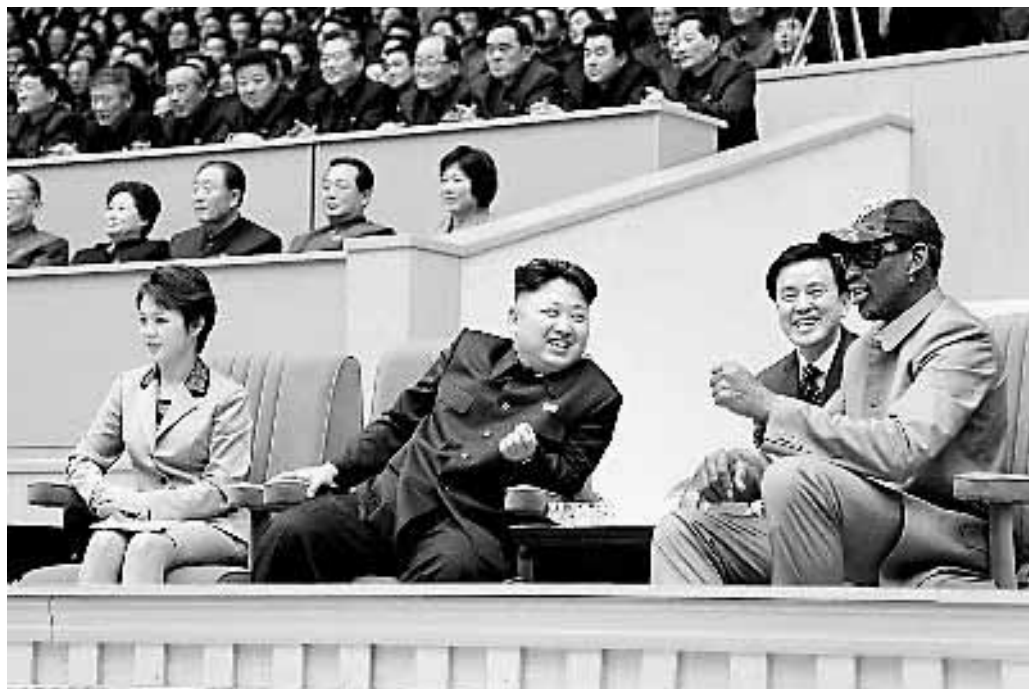
8日,金正恩偕夫人李雪主到现场观看朝美篮球赛,与罗德曼(右一)交谈甚欢。

“愚蠢、怪异、利欲熏心……”“杂耍”。8日,美国媒体从字典里掏出各式各样的贬义词,一股脑儿向正在平壤用篮球赛为金正恩庆生的前NBA球星罗德曼。虽也有人认同他“打开与朝交往的一扇门”,但更多美国人还是迅速将他此前被外界期许的“篮球外交”贬低为