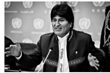
77国集团主席交接仪式8日在纽约联合国总部举行。玻利维亚接替斐济出任该组织2014年度主席。图为1月8日,在纽约联合国总部,玻利维亚总统莫拉莱斯出席77国集团主席交接仪式后的新闻发布会。