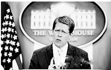
白宫发言人卡尼蓄须前后的照片对比(如上图)。

据广州日报消息 据外媒8日报道,美国白宫发言人卡尼日前一改清爽整洁的形象,留起胡须,由“奶油小生”变“硬汉”。