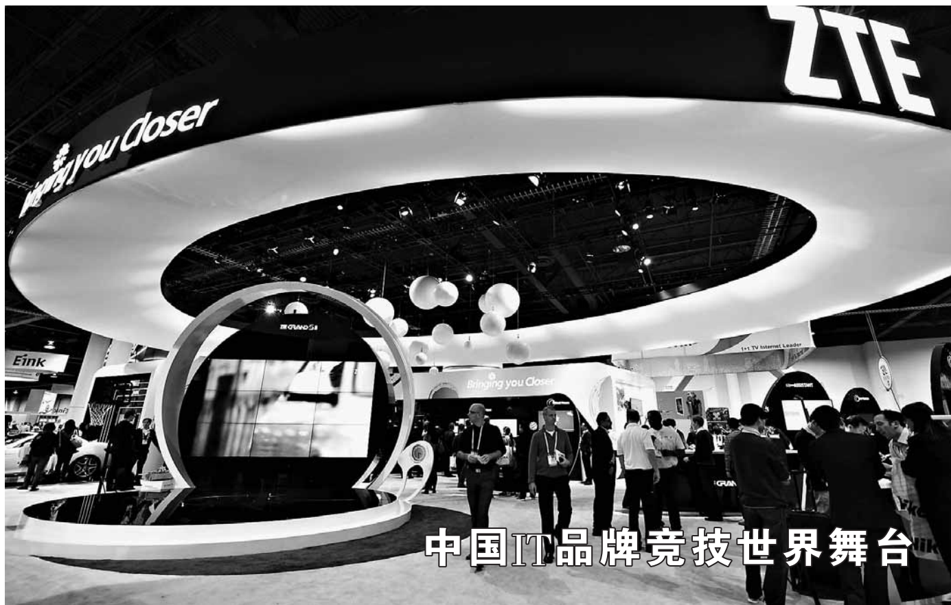
2014年国际消费电子展于7日在拉斯韦加斯正式开幕,众多中国企业精彩亮相。图为1月8日,在2014年拉斯韦加斯国际消费电子展上,中兴公司的展厅吸引了众多参观者。

藤田说,日本修复与邻国关系的唯一方法是,安倍必须继承村山谈话的精神,诚心诚意反省历史,切实采取行动,不再参拜靖国神社。否则,日本与中韩关系将很难修复。