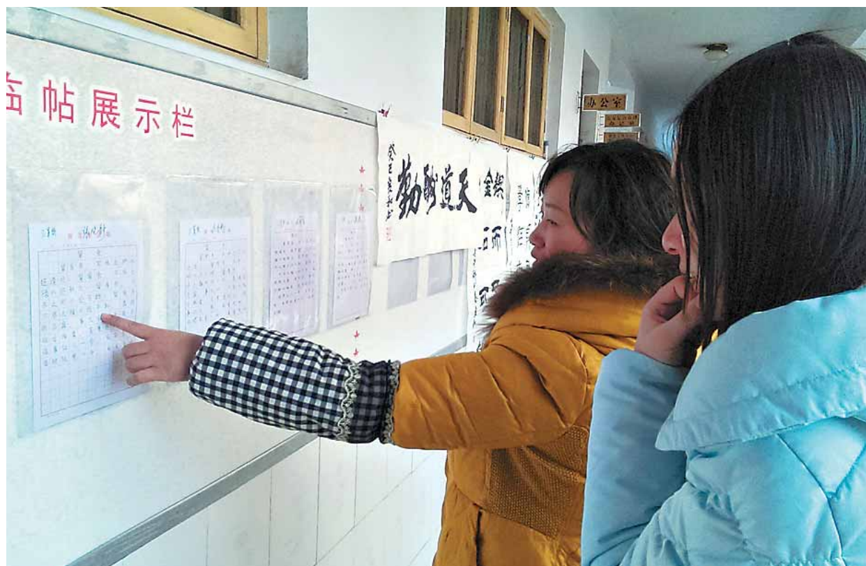
近日,淇县人口计生委组织机关40余人举办了青年干部书法比赛,通过楷书、行书、隶书等形式竞献绝技,并将优秀作品进行展示,促进青年干部相互学习。

以改进工作作风为着力点,进一步强化工作保障。深入开展“改作风、转职能、优环境”专项活动,推动政府把工作重点转向营造公平竞争市场环境、保护生态环境、支持创新上,为群众、基层、企业提供便捷高效的服务;扎实开展党的群众路线教育实践活动,全面落实改进工作作风、密切联系群众的各项规定;认真落实党风廉政建设责任制,完善惩防体系,坚持监督从严,营造干部清正、政府清廉、政治清明好环境。(崔长国 靳文)