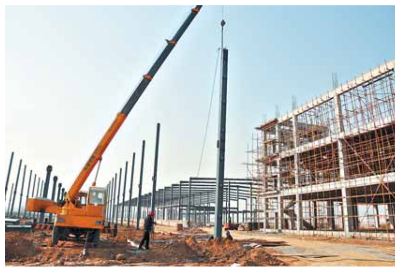
日前,位于鹤淇产业集聚区,总投资7.4亿元的合基电网优设备生产研发基地项目正在加紧施工。

属镁终端产品生产基地。力争河南飞天农业公司实现国内主板上市,并重点培育河南大用集团等3家上市后备企业。以城乡一体化建设为重点,着力推进新型城镇化。加强县城、鹤淇产业集聚区和特色商务区基础设施和公共服务设施建设,畅通与市区连接的107