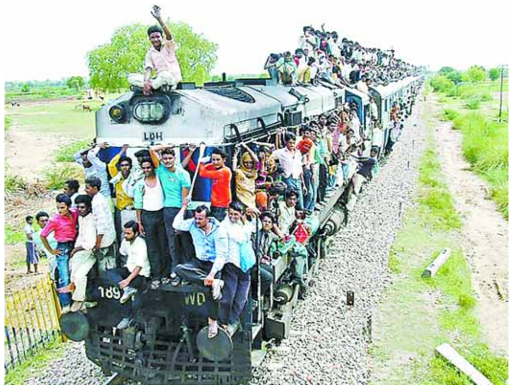
2010年7月24日,印度新德里,民众坐在火车顶上赶赴歌师节的庆祝活动。据统计,印度铁路每年运送旅客高达60亿人次。