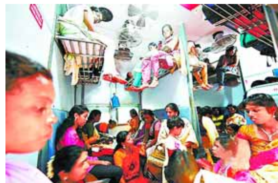
2012年11月11日,印度金奈,参加完排灯节后返乡的民众将火车车厢挤得水泄不通。印度铁路是世界最繁忙的铁路之一,每天运营列车1.4万多列,其中客车8700余列。