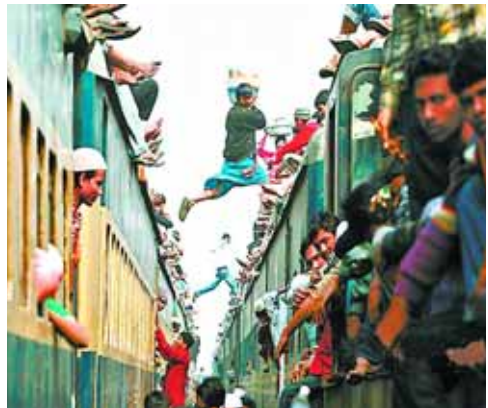
2011年1月23日,孟加拉国达卡市,火车上挤满了回家参加伊斯兰教集会的民众,小贩在拥挤的火车顶上穿梭兜售商品。