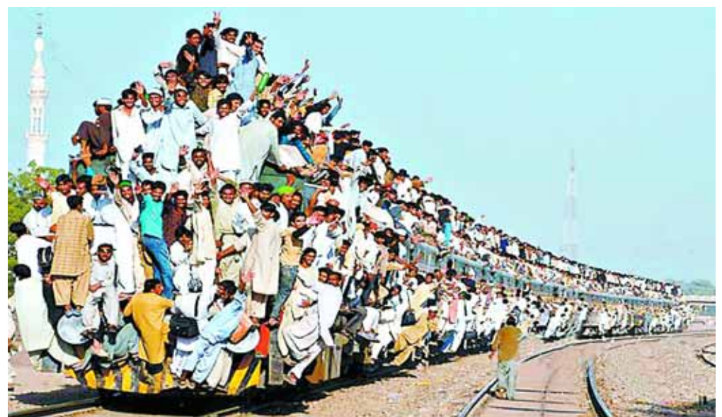
2008年11月2日,巴基斯坦坦木尔坦,数10万逊尼派穆斯林参加宗教聚会后,乘火车返家。车顶和车厢周围都是以各种高难度动作和姿势搭乘火车的人,远远望去,乘客都像在表演“杂技”,令人叹为观止。